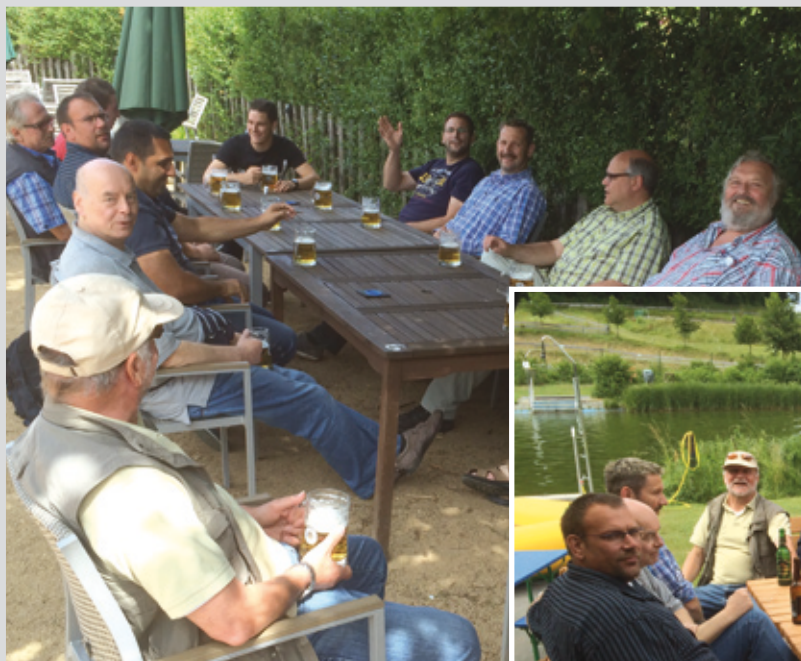
bestes Wetter und gute Stimmung ...

Die vierte Mannschaft konnte die in sie gesetzten Erwartungen auf einen Aufstiegsplatz bisher nicht erfüllen. Mit 5:5 Punkten in der 3. Kreisklasse Gr. 3 liegt die „Vierte“ derzeit auf Platz 5. Hat aber die „vermeintlich“ schweren Gegner in der Kreisklasse schon hinter sich.