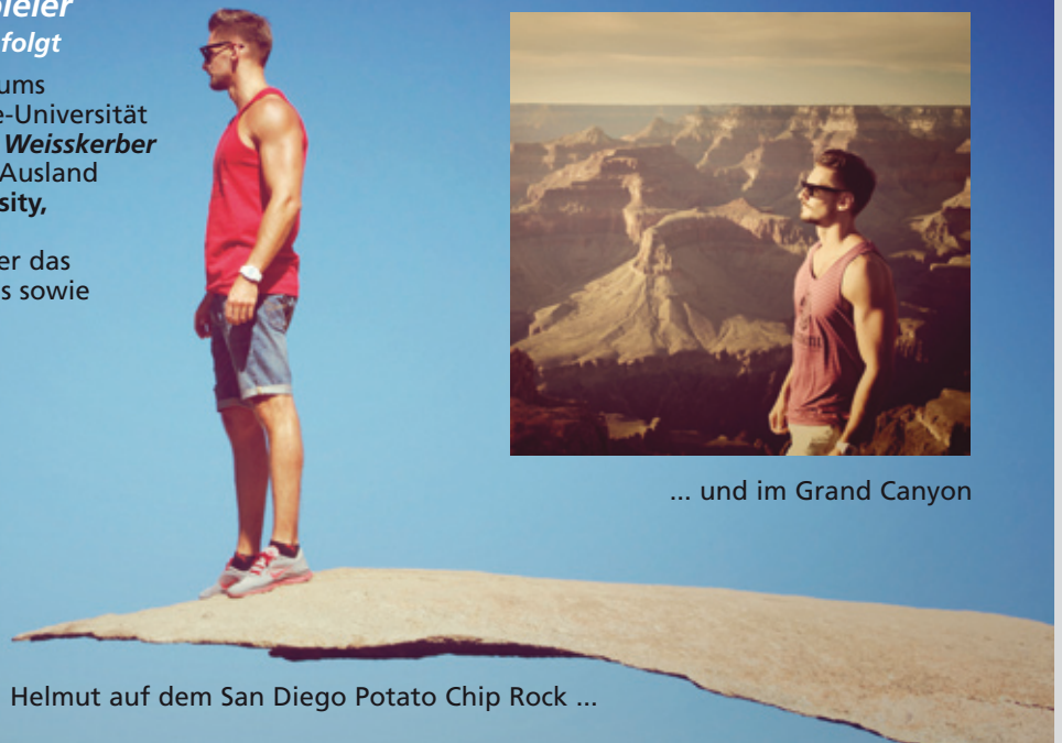
... und im Grand Canyon